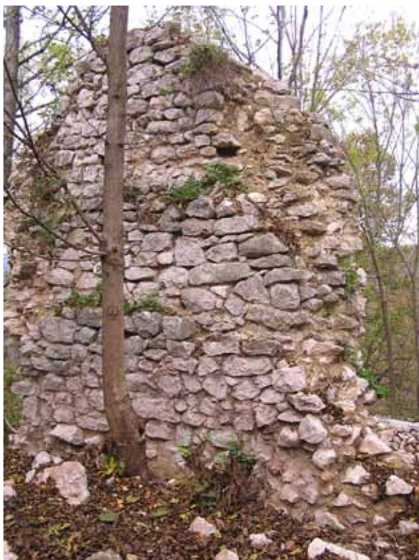
2. kép Szádvár. A kaputorony északi fala dél felől

A belső vár területén a kaputoronytól északra emelkedő falcsonktól nyugatra nyitott kutatóárokban az utolsó járósíntet egy téglapadló formájában azonosítottuk. Ezen a területen azután észak felé haladva megtisztítottuk a belsővár falának északkeleti sarkát, tehát a külső várfal tetejét és a