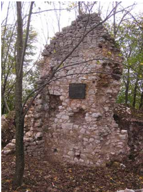
3. kép Szádvár. A kaputorony északi fala észak felől

épülethez tartozhatott – ennek téglapadlóját említettük az előzőekben (1. kép 6).