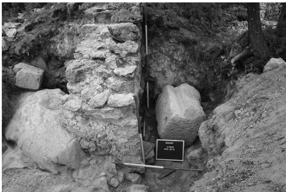
3. kép A középső és külső vár kapujának északi lezárása