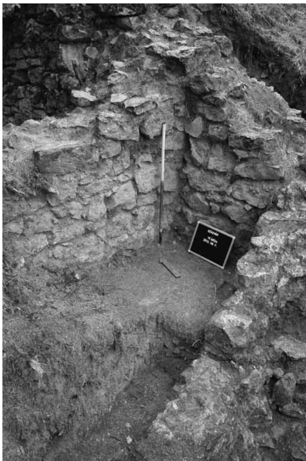
4. kép A Német bástya északnyugati sarkában előkerült falaka rendszere

Az idei feltárás számos eredmény mellett több új kérdést is felvetett, melyekre jövőre, talán az ásítás kibővítésével, valamint új kutatási területek bevonásával próbálhatunk megválaszolni.