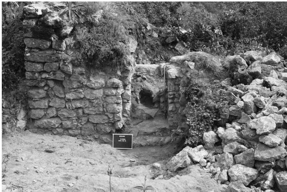
2. kép Szádvár kapuépületének északi fala a nyílással